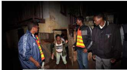
Des policiers effectuent une descente dans une maison de passe clandestine d'Antananarivo. Les filles sont embarquées au poste.

DE SON CÔTÉ, LA JUSTICE ÉPROUVE LES PIRES DIFFICULTÉS À FAIRE SON TRAVAIL. Une personne reconnue coupable d'agression sexuelle contre un mineur risque une peine d'emprisonnement de 5 à 10 ans et une amende de 10 à 50 millions de francs malgaches, soit 730 à 3 650 euros. Mais les autorités se heurtent à deux obstacles de taille : la corruption des policiers et la complicité des parents. Beaucoup d'affaires ne sont pas traitées car les familles préfèrent ne pas porter plainte. Certains ressortissants ont certes été condamnés par la justice, mais la plupart des prédateurs sexuels passent entre les mailles du filet. Les prédateurs n'ont pas fini de chasser leurs proies. *