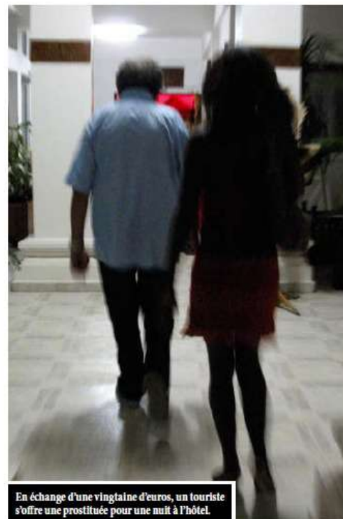
En échange d'une vingtaine d'euros, un touriste s'offre une prostituée pour une nuit à l'hôtel.