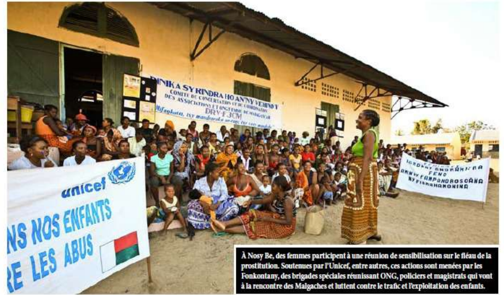
À Nosy Be, des femmes participent à une réunion de sensibilisation sur le fléau de la prostitution. Soutenues par l'Unicef, entre autres, ces actions sont menées par les Fonkontany, des brigades spéciales réunissant ONG, policiers et magistrats qui vont à la rencontre des Malgaches et luttent contre le trafic et l'exploitation des enfants.