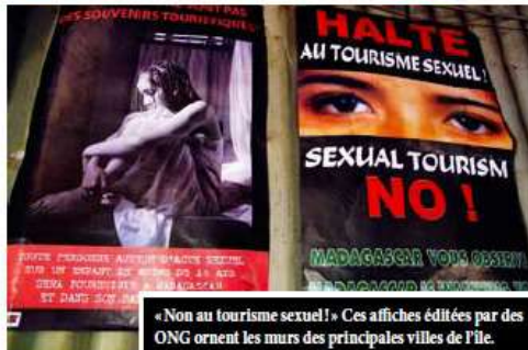
« Non au tourisme sexuel ! » Ces affiches éditées par des ONG ornent les murs des principales villes de l'île.