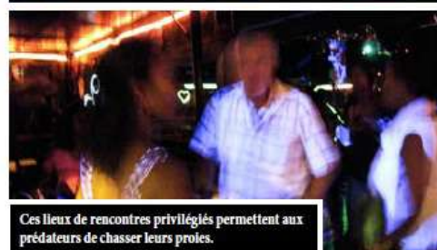
Ces lieux de rencontres privilégiés permettent aux prédateurs de chasser leurs proies.