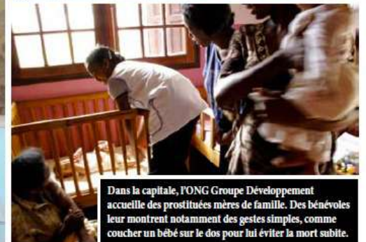
Dans la capitale, l'ONG Groupe Développement accueille des prostituées mères de famille. Des bénévoles leur montrent notamment des gestes simples, comme coucher un bébé sur le dos pour lui éviter la mort subite.