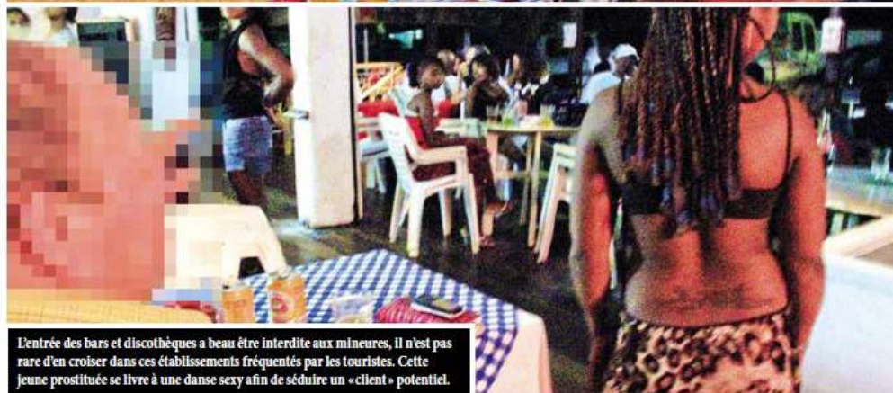
L'entrée des bars et discothèques a beau être interdite aux mineurs, il n'est pas rare d'en croiser dans ces établissements fréquentés par les touristes. Cette jeune prostituée se livre à une danse sexy afin de séduire un « client » potentiel.