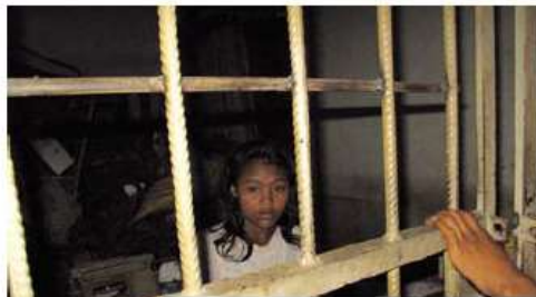
Arrêtée, cette prostituée mineure n'a pas de papiers d'identité. Elle passera la nuit en garde à vue.