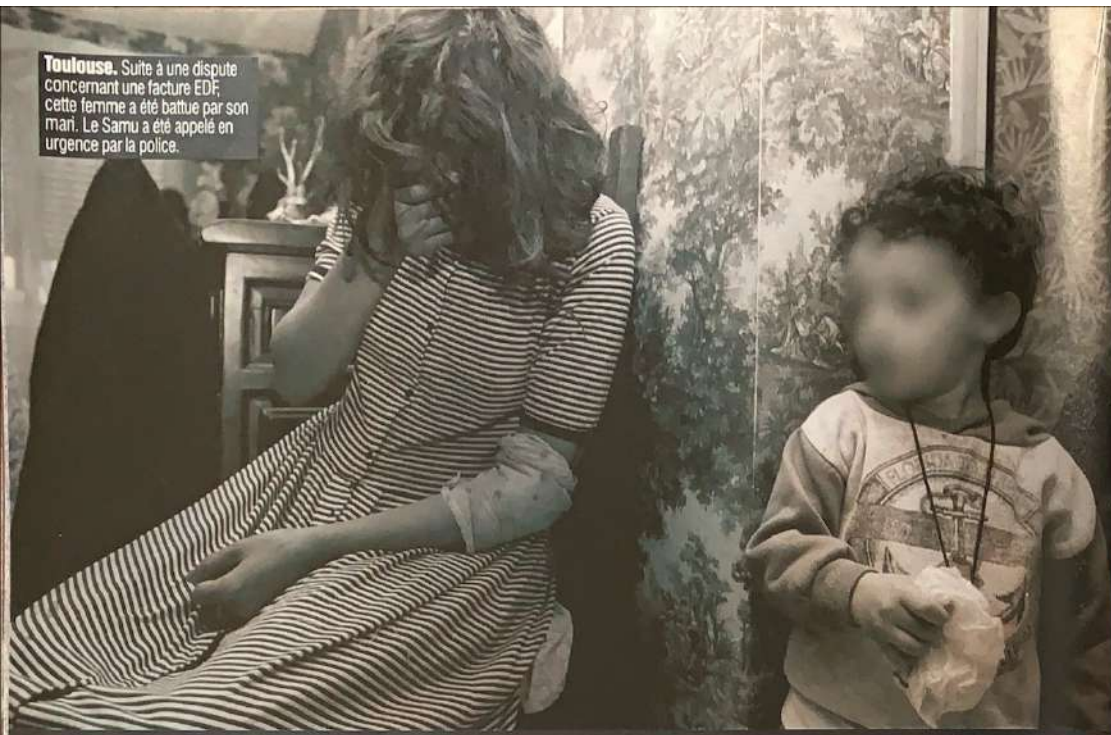
Toulouse. Suite à une dispute concernant une facture EDF, cette femme a été battue par son mari. Le Samu a été appelé en urgence par la police.