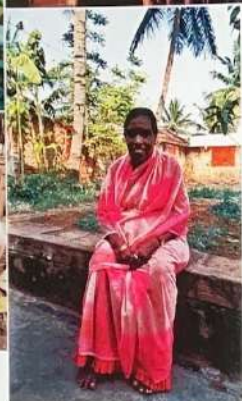
2.3.4. Suvama, 接生婆，但同时也是扼杀者和投毒者。Suvama一辈子都从事接生的工作，她也杀死了无法计数的女婴，或者把她们放在瓦罐里闷死，或者用牛角瓜的毒液毒死这些孩子。

甚至女工程师们也尽量避免生下女孩。”Soubhagya K.Bhat哀叹，“国家控制生育的政策并没有起到任何帮助，人们总是想：既然要少生孩子，那至少得保证生下一个男孩。”