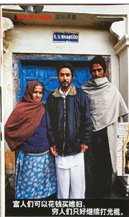
富人们可以花钱买媳妇， 穷人们只好继续打光棍。