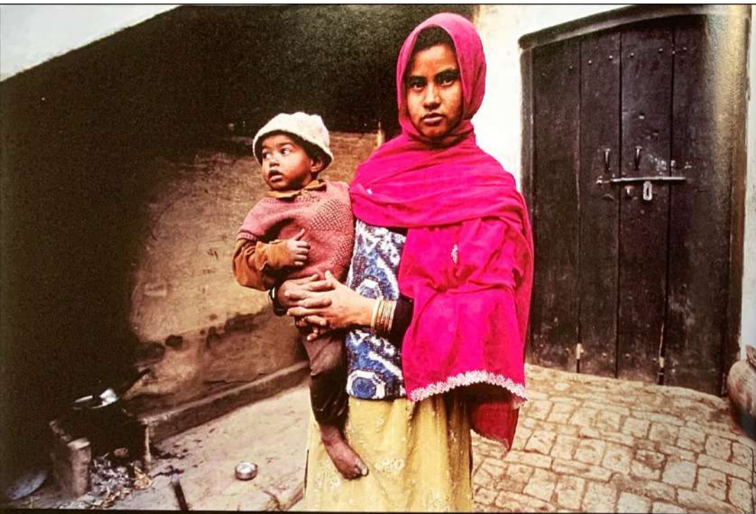
在那些女人紧缺的村子里，很多媳妇都是向人贩子买来的。