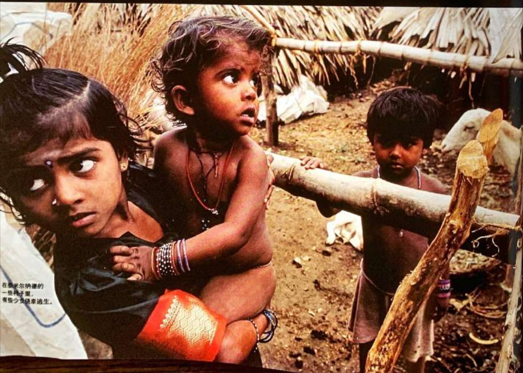
在莫尔纳德的一些村子里，有些少女被强迫卖淫。